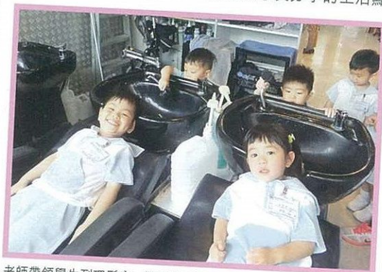
老師帶領學生到理髮店，認識洗頭及剪髮的過程。

「家長知道孩子在學校參與的活動，有助他們與學校建立更緊密的關係，提升對學校的信任。」在學生手冊中，設有供家長分享的生活點滴欄，家長可寫下對學校的感受，或是與孩子的活動；老師亦會於手冊上作回應，鞏固彼此的關係。