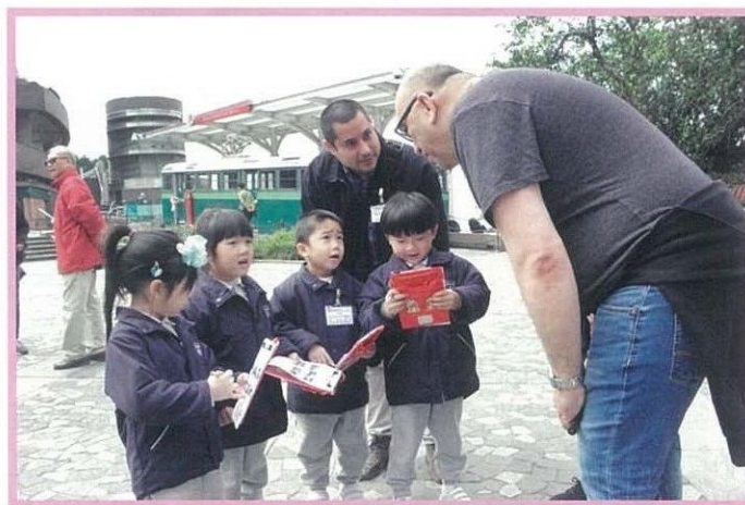
乘纜車遊覽山頂期間，學生訪問外國遊客。