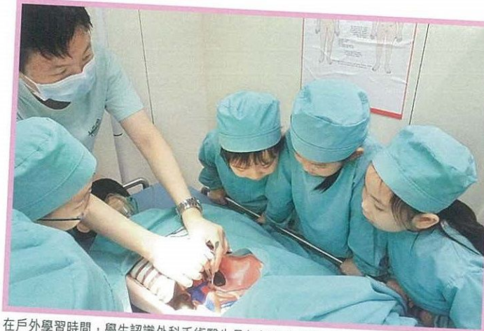
在戶外學習時間，學生認識外科手術醫生是如何為病人施行手術。