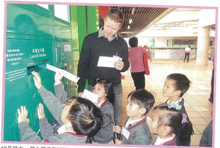
12月其中一個主題是聖誕節，學生會寄聖誕卡給聖誕老人。