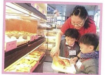
「購物樂融融」活動中，學生到麵包店購買麵包，體驗購物的過程。

K2學生除了於答問題時需學習輪候，更進深地灌輸他們建立分享的意識，教導他們要適當地讓其他幼兒有答題的機會；進食前要等齊人；父母請自己幫忙時要作出回應；分清何為應該快快做的事情，和可以延遲才做的事情等。K3學生則需學習管理自己的情緒，例如喜歡的食物被人吃了，不要急着指罵別人；發現他人做錯事，不要取笑別人；玩遊戲、看電視等要有節制。學校希望透過各種生活化的事情，加強學生的同理心。