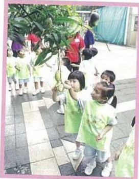
校園內種了芒果樹，學生看見芒果均十分興奮。

學校以雙語形式授課，中文課程配合教育局的課程指引而編訂，亦包括普通話學習活動。英文課程由專業外籍老師負責，特別着重英文拼音，讓學生在生活化的學習環境中，擴展並鞏固英語能力。在語文發展方面的課程，包括全語文故事、漢字遊戲、小作家、普通話課程、英語拼音課程、創意英文故事坊及英文圖書朗讀等。另外，學校也會透過操作式數學、網絡思維遊戲及科技資訊課程，培養幼兒的邏輯思維。在上課前，全校師生會一起進行韻律操、不同項目的運動鍛煉、幼兒網球、小肌肉活動、舞蹈、話劇、創意藝術及名畫欣賞等，以發展幼兒的體藝。學校十分重視生命教育，會透過基督教教育及活動、品格及公民教育、比比和朋友情緒課程等，助幼兒建立正向的生命價值觀。