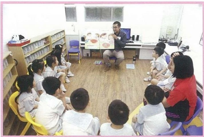
外籍老師與學生說故事，學生聽得十分入神。