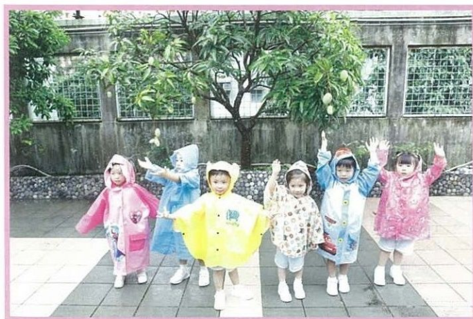
下雨天，老師會帶領學生到學校天台，穿上雨衣感受下雨的氣氛。

學校是一所基督教幼稚園，龍校長指培養孩子的正確價值觀及良好品德，對於他們的日後成長十分重要。因此，學校以耶穌基督的教導為生活原則，在生命教育與品格發展上，向幼兒灌輸正確的價值觀，建立他們學習自處及與他人相處的正確態度。「若學生的學術成績優異，但沒有謙卑的態度，將來他們的成就總會有限；但若孩子擁有一顆關愛及願意幫助他人的心，不管遇上甚麼困難，也會在有愛的環境中，大家一起分擔和面對，邁向成功。」故品德教育方面，學校把不同的聖經教導融入生活之中，培養幼兒的良好品行。