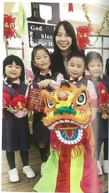
在農曆新年前，學校會舉辦迎春活動。

學校會提供不同的機會讓孩子學習如何愛，將彼此相愛付諸行動。例如高年班的「愛心服務生」會負責照顧校內的小弟妹，於上學時段帶領他們進入課室，學習照顧幼小。每年農曆新年前又會舉辦「喜氣洋洋敬老日」，邀請家中長者到校欣賞賀年表演，並接受孫兒的