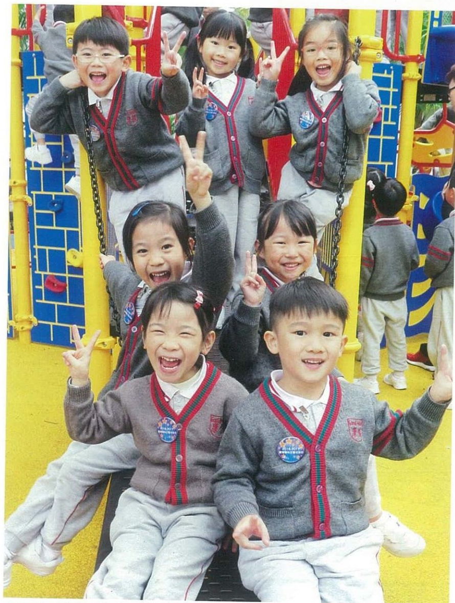
學校提供幼兒自由玩樂時間，走出校園，體驗戶外樂趣。

龍鳳霞總校長表示，在香港這片福地，孩子的生活條件實在非常豐足，故此一定要培養孩子有一顆知足和感恩的心，同時更要學習體恤他人的需要，以愛服侍他人，就如早前學校舉辦了一個「傳愛到山區」的活動，目的是幫助遠在中國的山區兒童。事前，校方便設計了講座、無鞋子日、無桌椅日等一系列的活動，讓孩子認識山區兒童簡樸的生活，體驗沒有鞋子、沒有桌椅的不便，從而激發孩子的愛心。