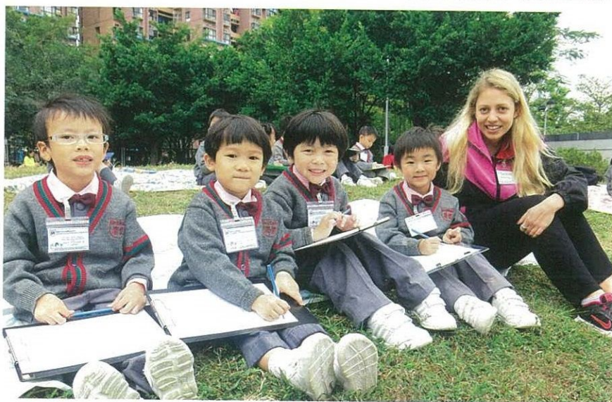
設校外寫生課，學會觀察四周環境。