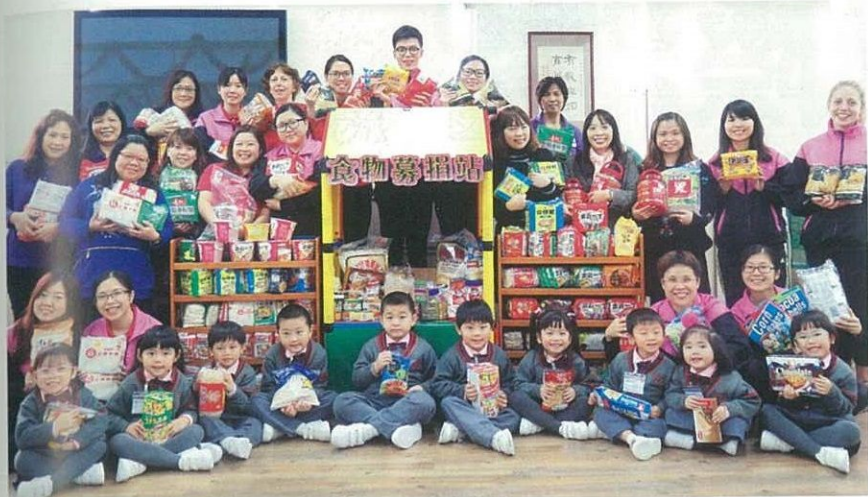
校內特設食物募捐站，讓學生學會幫助有需要的人。