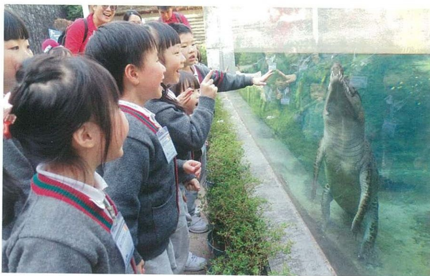
老師帶學生外出參觀，親身接觸大自然。