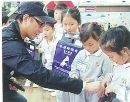
讓學生參與賣旗活動，將愛心付諸行動。