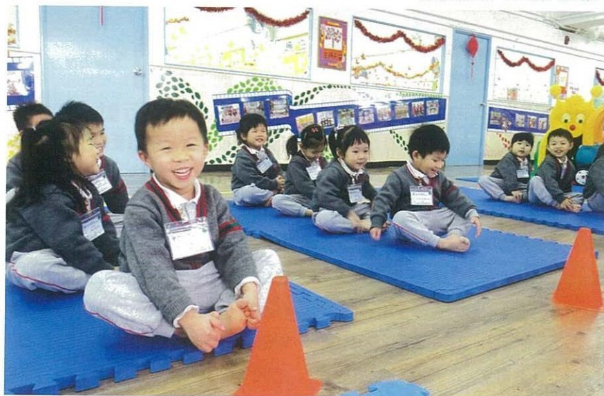
舉辦團隊協作遊戲，同學間互相合作完成任務。