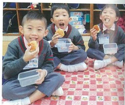
今天是無桌椅日，大家坐在地上吃茶點。